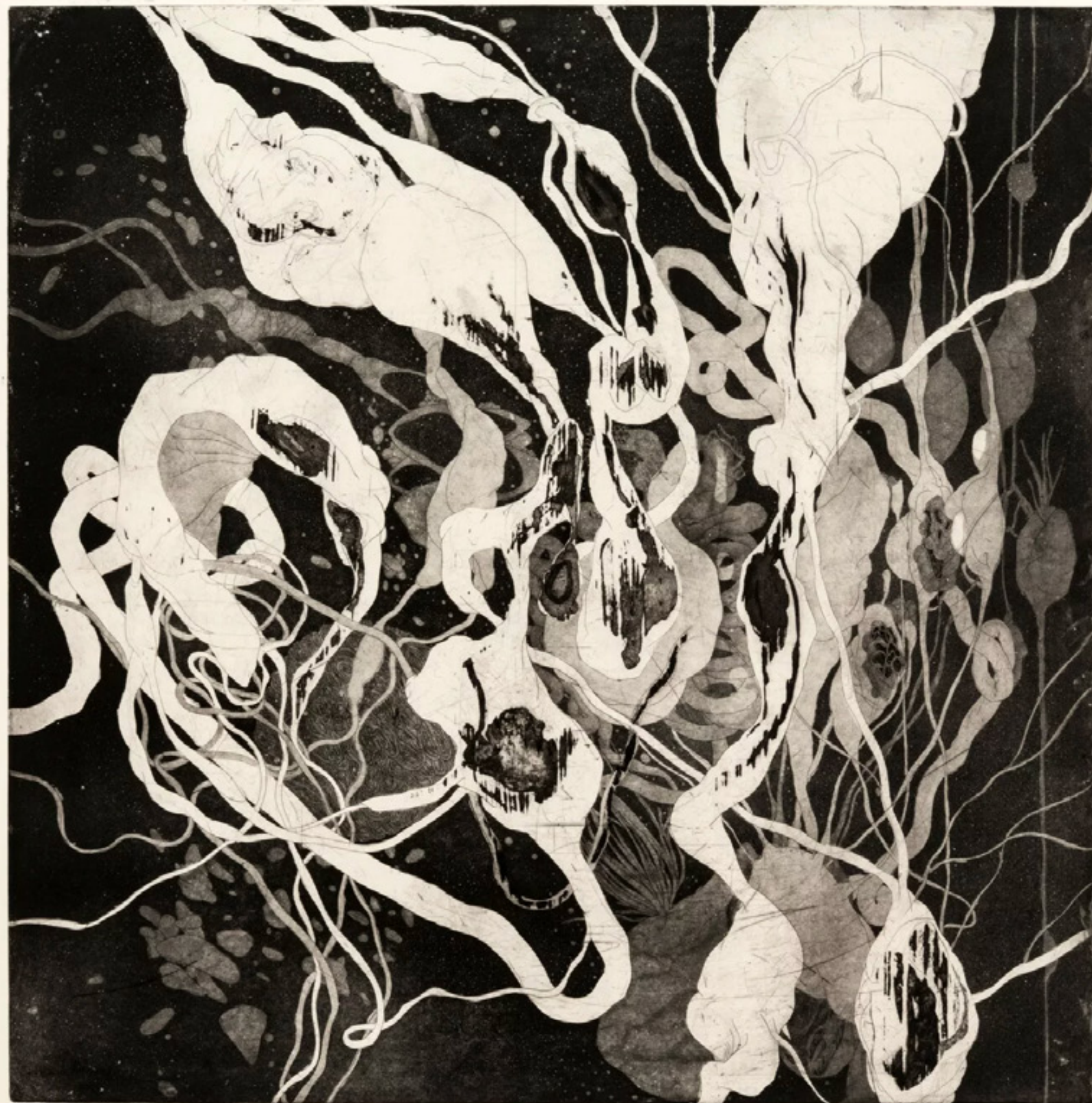
Aguas oscuras / 80 x 80 cm / aguafuerte y aguainta / 2019 Dark waters / 80 x 80 cm / etching / 2019