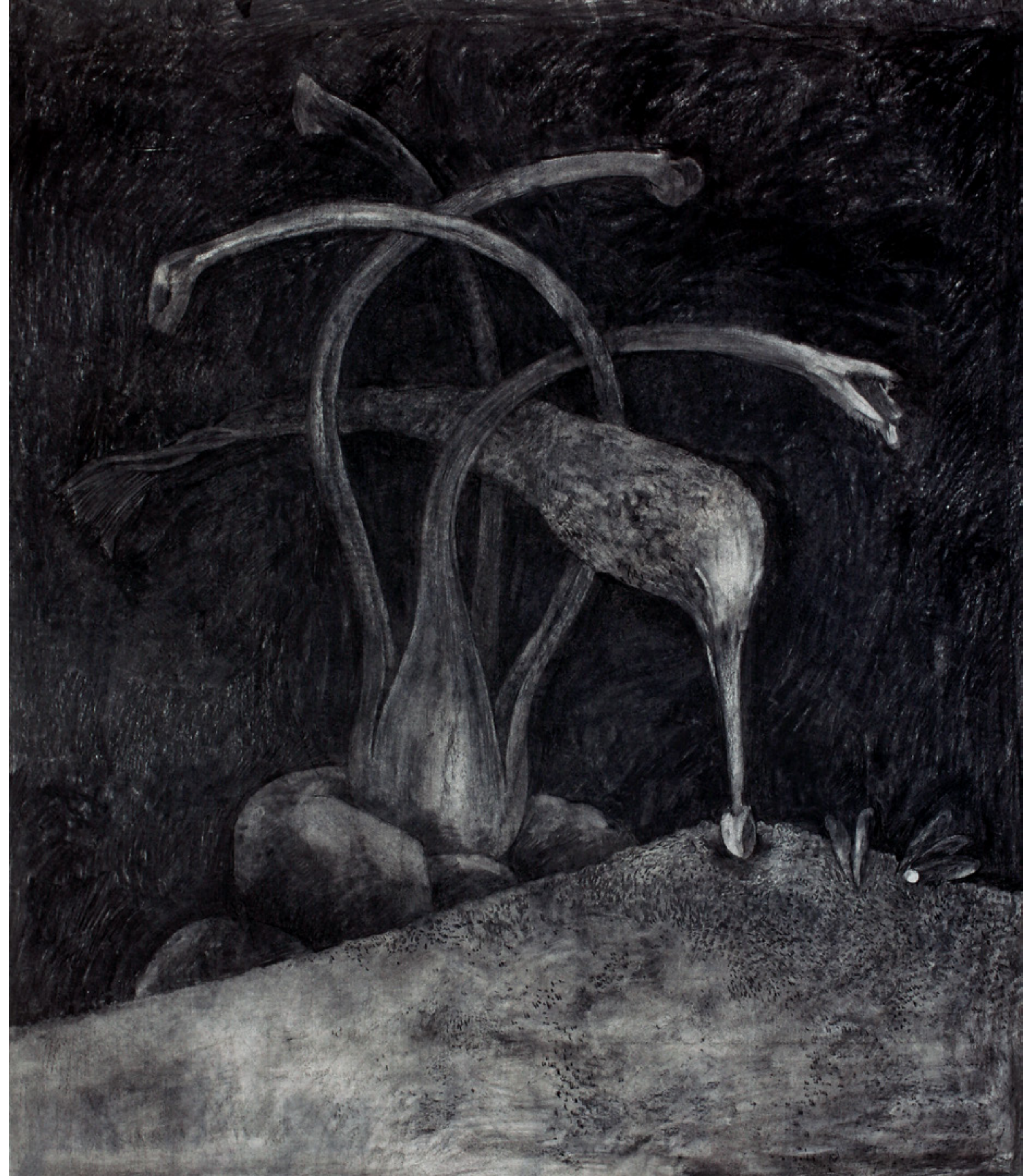
Pájaro-pezo La captura 110 x 130 cm / carbonilla sobre papel / 2020 Pájaro-pezo (Fish-bird), charcoal on paper 110 x 130 cm / charcoal on paper / 2020