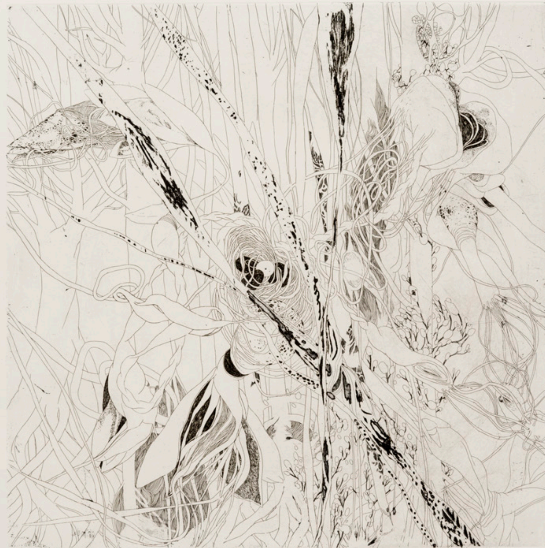
Selva / 80 x 80 cm / aguafuerte / 2019 Jungle / 80 x 80 cm / etching / 2019