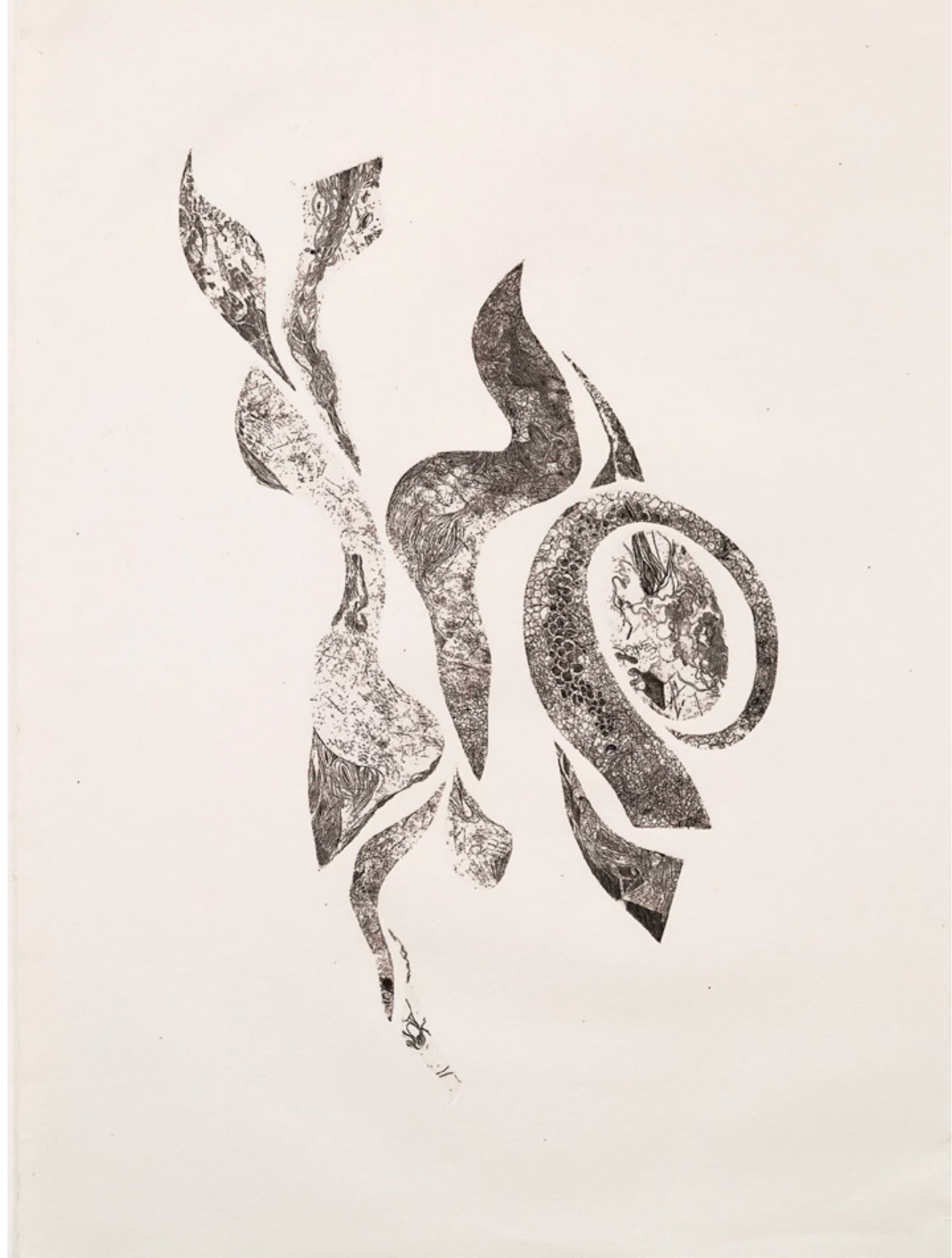
Paisaje interior / 75 x 55 cm / grabado sobre metal / 2022 Interior landscape / 75 x 55 cm / etching / 2022