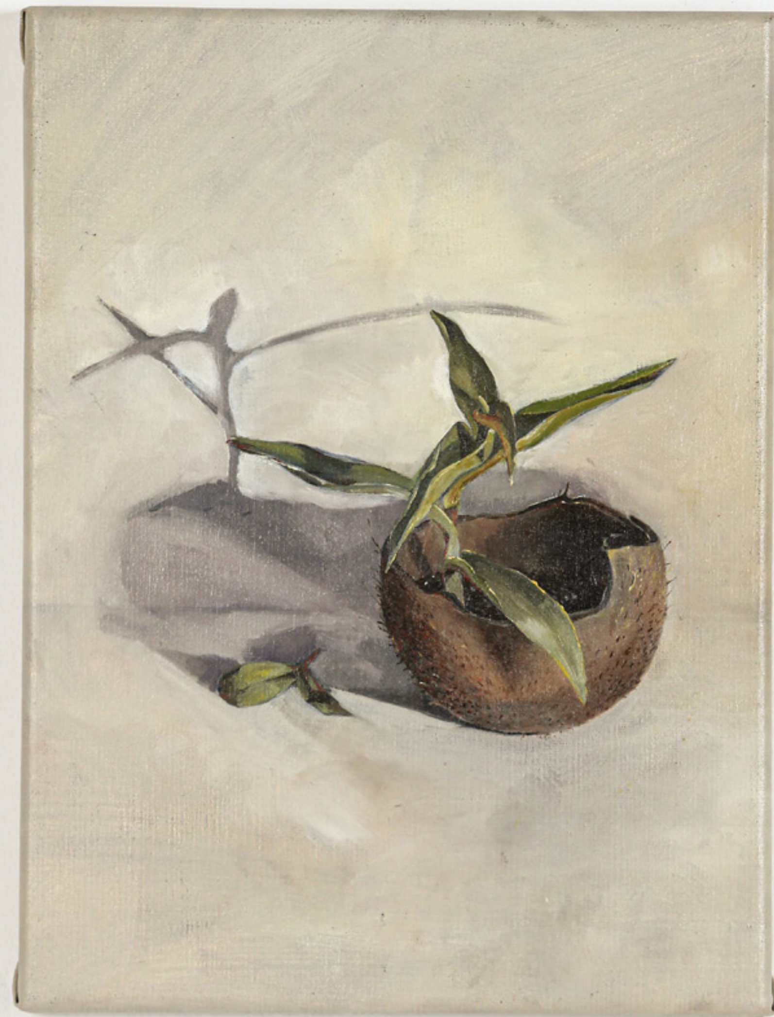
Coco / 33 x 25 cm / óleo sobre tela / 2022 Coco / 33 x 25 cm / oil on canvas / 2022