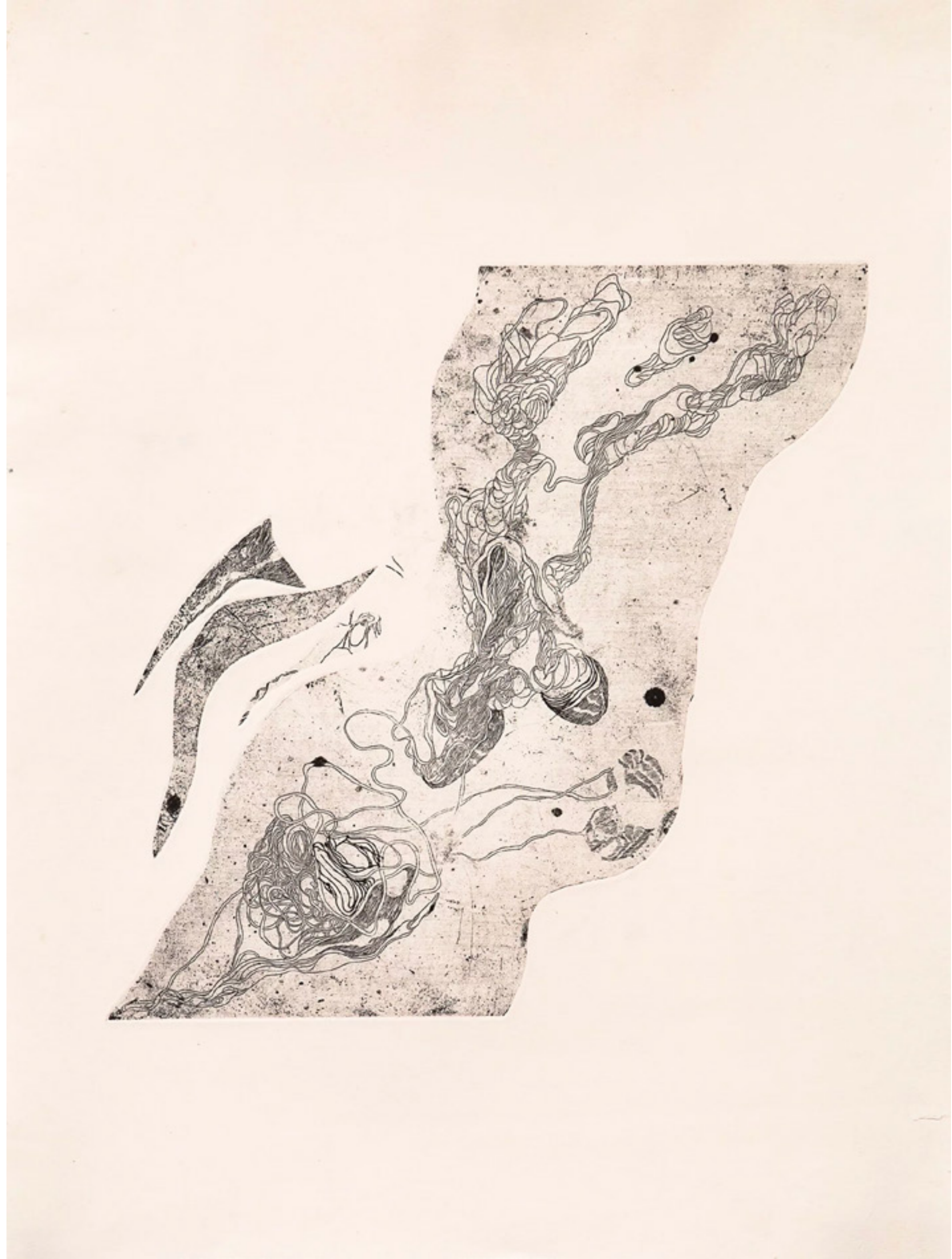
Paisaje interior / 53 x 38 cm / grabado sobre metal / 2022 Interior landscape / 53 x 38 cm / etching / 2022