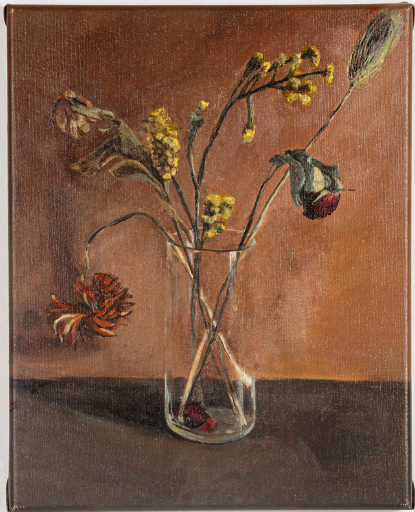
Flores / 35 x 28 cm / óleo sobre tela / 2022 Flowers / 35 x 28 cm / oil on canvas / 2022