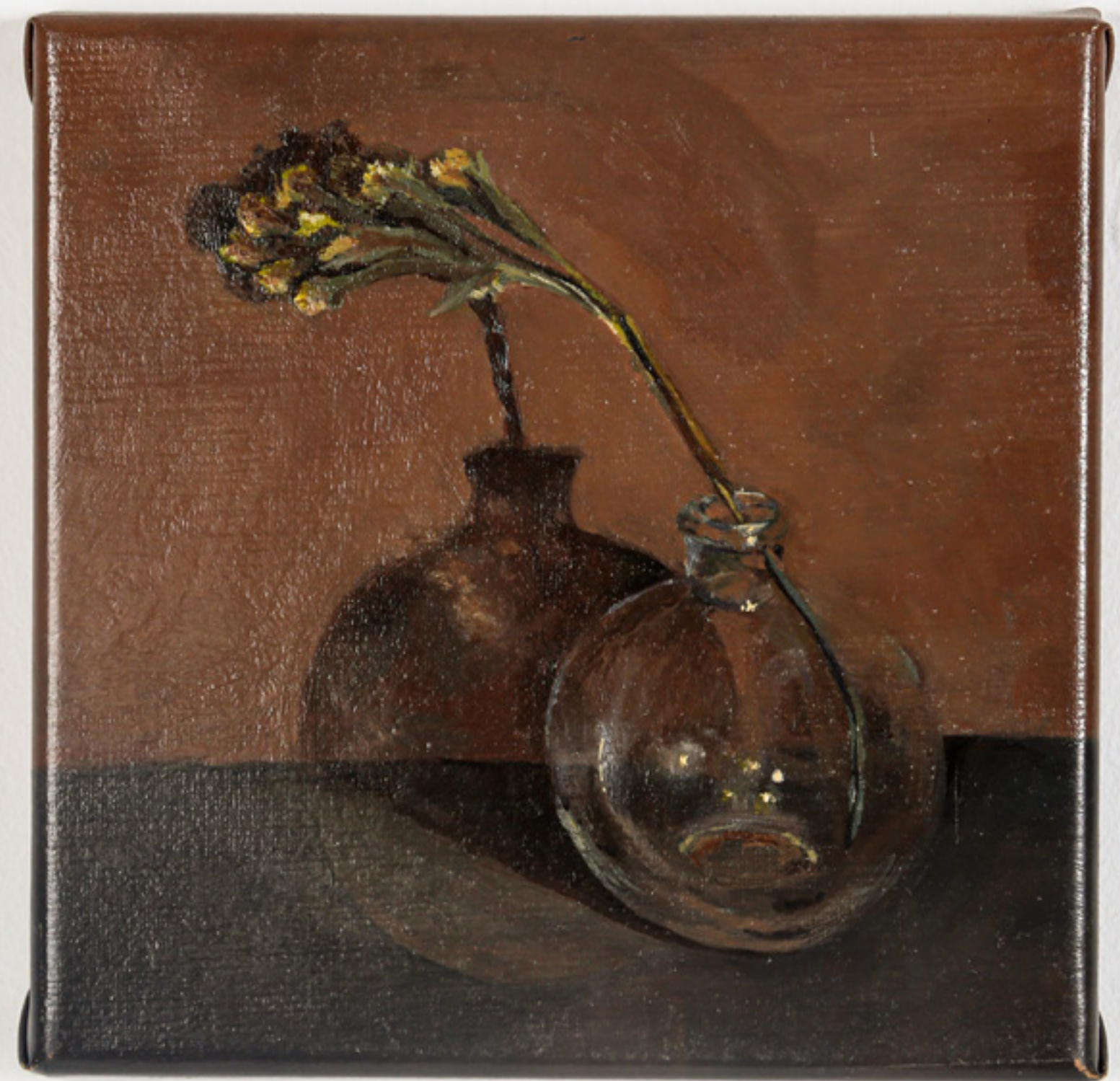
Reflejo / 20 x 20 cm / óleo sobre tela / 2022 Reflection / 20 x 20 cm / oil on canvas / 2022