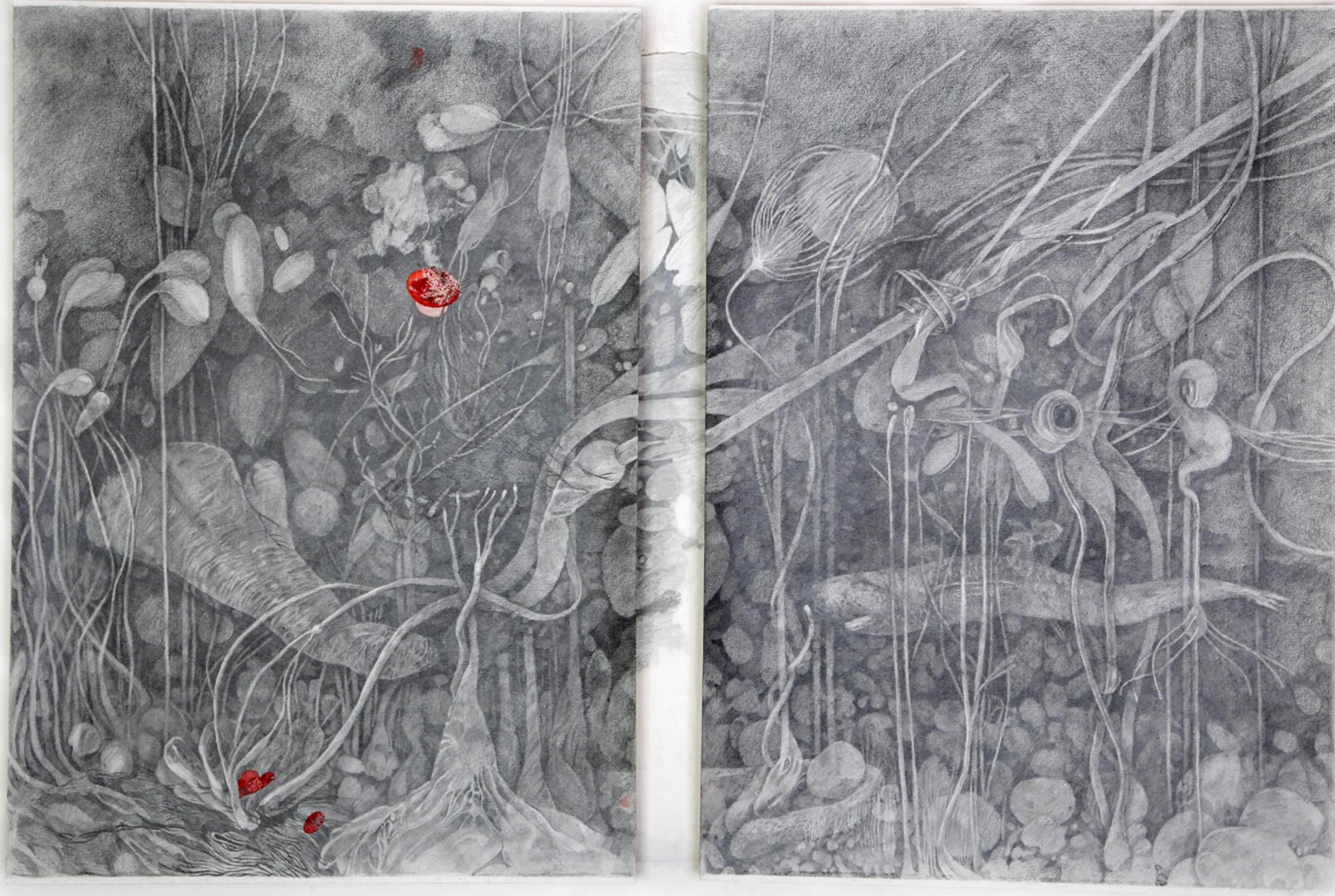
Mi amor me llevó al fondo del mar / 90 x 70 cm, cada uno / lápiz y tinta sobre papel / 2020 My love took me to the bottom of the sea / 90 x 70 cm each / Pencil and ink on paper / 2020