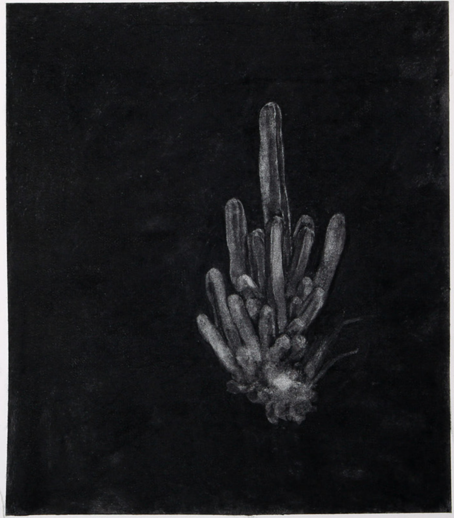
Cactus, díptico, de la serie Nocturno / 120 x 66 cm / carbonilla sobre papel / 2020 Cactus, diptych / 120 x 66 cm / charcoal on paper / 2020